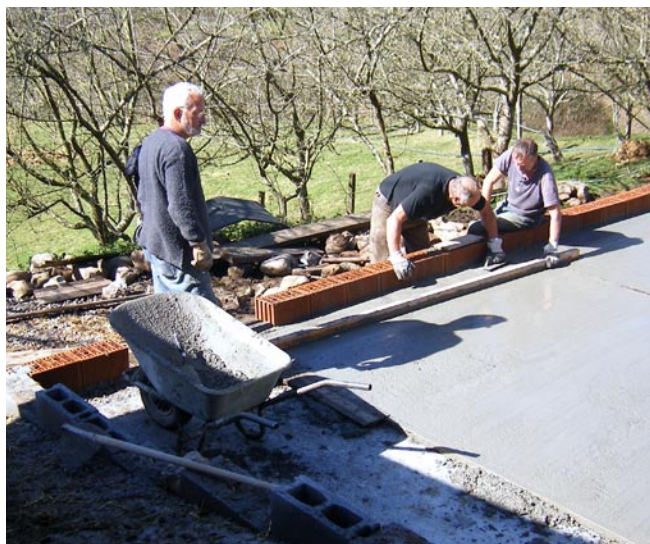
Cees, Bert en Aart maken de fundering en de vloer voor de tweede ezelstal

De parkeerplaats is nu bijna klaar en in de moestuin verrees een vriendelijk tuinhuisje, met prachtig uitzicht op de Cordillera del Sueve. Een groot stuk boomgaard is nu geschoond, dat wil zeggen dat de manshoge braamstruiken en dode bomen zijn verwijderd en de zon weer kans krijgt de aarde te verwarmen. Onze caravans liepen in een orkaan nogal wat schade op. Stukje bij beetje worden ze gerepareerd. Een oud afdak met zompige grond eronder werd omgetoverd tot stal voor noodopvang. En onze ezels kregen een beter begaanbare staluitgang.