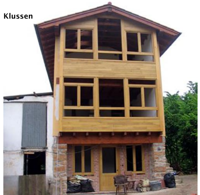
Het nieuwe woonhuis krijgt, omdat het niet groot is, drie verdiepingen met aan de voorkant veel glas.